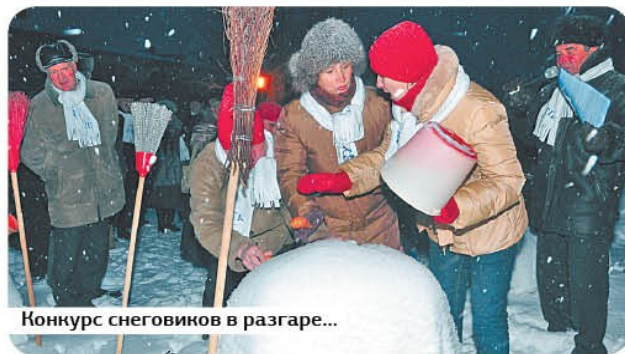
Конкурс снеговиков в разгаре...

Если вы хотите своими глазами увидеть ледовые скульптуры, спешите в ботанический сад на Которосльной набережной, 46г. Выставка открыта с 25 декабря по 25 февраля.