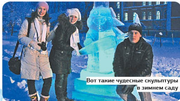
Вот такие чудесные скульптуры в зимнем саду