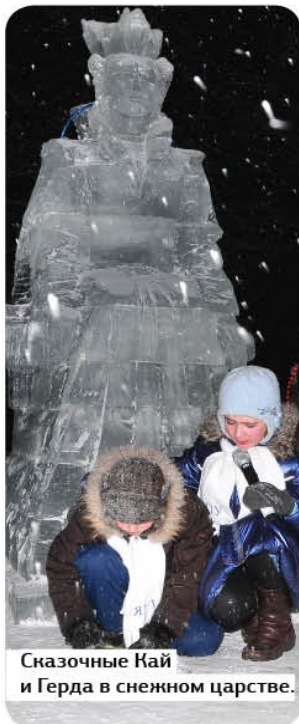
Сказочные Кай и Герда в снежном царстве.