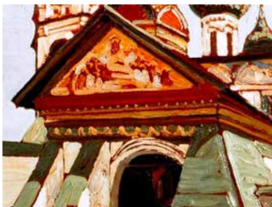
▲ Н. К. Рерих.

Есть опасения, что возможные находки, содержащие уникальную информацию о жизни Ярославля в 16-17 веках, могут погибнуть под ковшом экскаватора