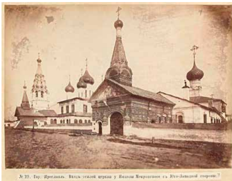
▲ Фото начала XX века