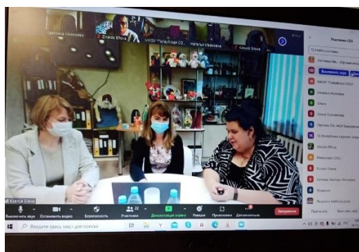
Финно-угорская средняя школа Петрозаводского городского округа

Тема совместного выступления Толвуйской и Финно-угорской школ «От шефства – к партнёрству. Практики сотрудничества городской и сельской школ» . Педагогические коллективы сельской и городской школ объединил проект «500+», определивший шефство успешных школ Петрозаводска над сельскими школами с низкими образовательными результатами, работающих в сложных социокультурных контекстах. Однако школы избрали иную тактику взаимодействия, а именно, партнёрство по трём направлениям взаимопольной деятельности: повышение квалификации учителей, сетевая организация обучения старшекласников, совместные образовательные СО-бытия.