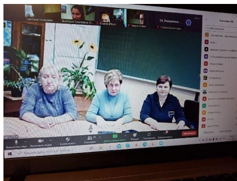
Кепская основная школа Калевальского района

«Малые формы больших дел» – такова тема презентации Кепской школы-детского сада. Школа работает в условиях множественных дефицитов, когда всего «мало» - обучающихся (17 школьников и 8 дошкольников), педагогов (7 человек), образовательных и материальных ресурсов. Большими являются только расстояния до ближайших культурных центров. Однако малокомплектная школа имеет успешный опыт "малых" дел со значительными образовательными и важными социальными эффектами. Например, создания креативной среды руками учителей и учеников - событийной трансформации пространства школы; организации акций разновозрастным добровольческим отрядом "ПроДобро" - социальных, экологических, трудовых, досуговых и др.; расширения и обогащения социальных контактов педагогов и школьников через поездки, экскурсии, участие во всероссийских мероприятиях.