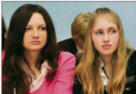
Журналистов детского телевидения интересовала демократия в отношениях учеников и учителей.

На этот раз в области состязались 24 учителя. Среди них, чего давно не было, трое мужчин. В финал областного конкурса вышли 6 педагогов-победителей муниципального этапа.