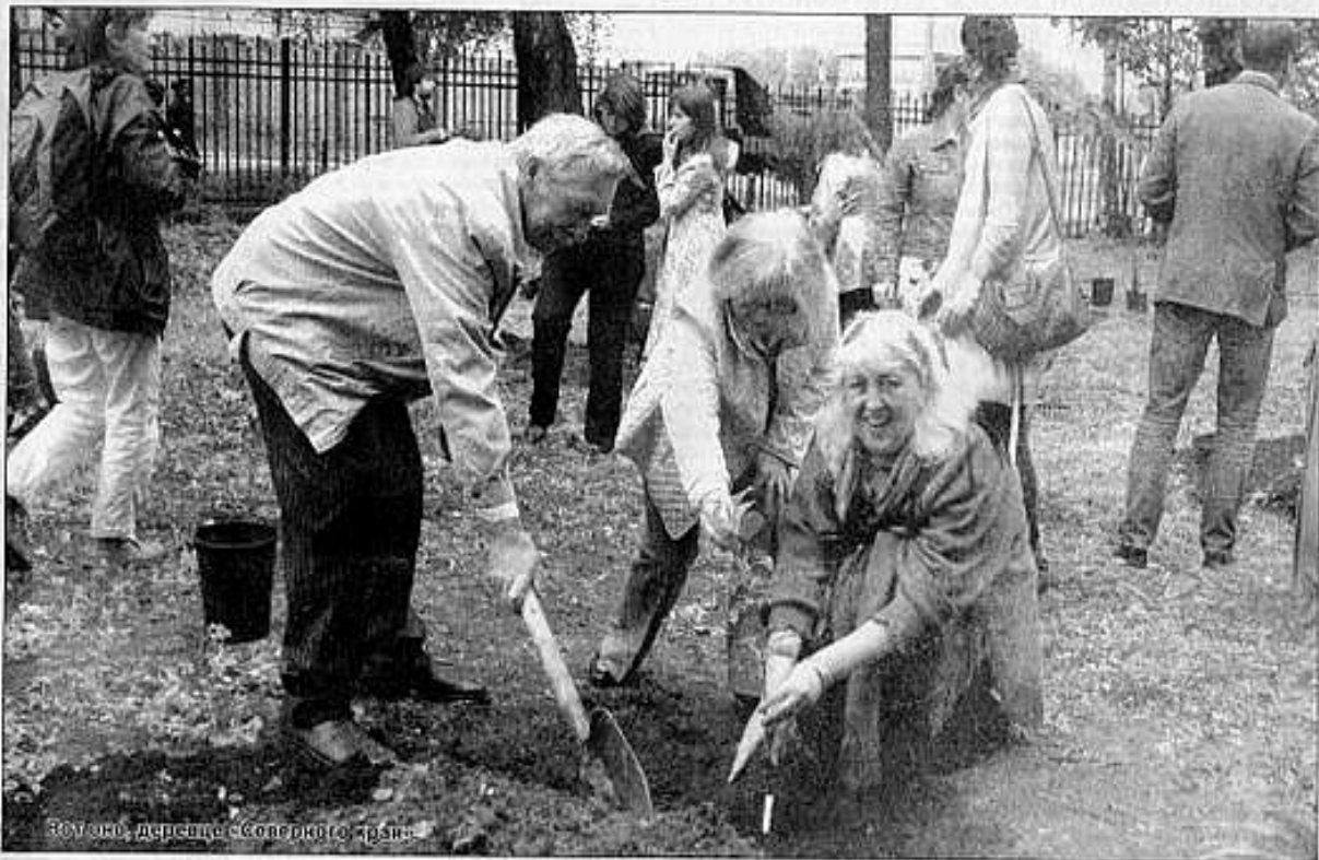
Заложено «дерево» «Северного края».

Закладка плодового сада «Мои учителя» стала частью программы реконструкции ботанического сада педуниверситета, начавшейся два года назад. Согласно плану его развития, идёт преобразование сада в культурно-туристский центр с открытой верандой для общения гостей, концертов классической музыки и авторской песни, фести-