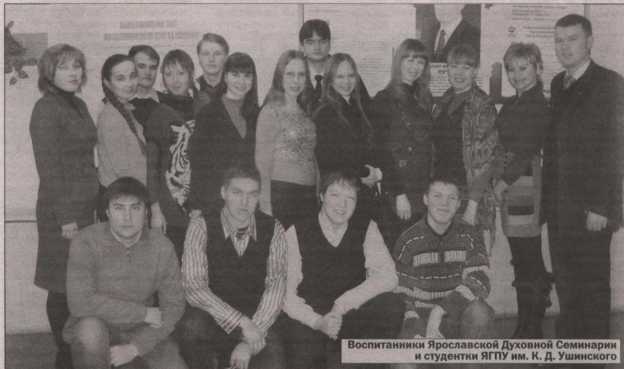
Воспитанники Ярославской Духовной Семинарии и студентки ЯГПУ им. К. Д. Ушинского