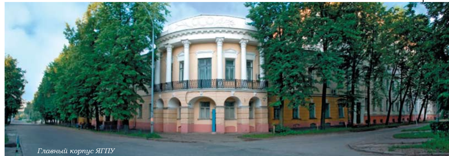
Главный корпус ЯГПУ

Однако стоит сказать и о некоторых проблемах. Главная из них в том, что вся эта двадцатилетняя работа проводится в рамках эксперимента. В свое время ни Госкомитет СССР, ни его преемник Министерство образования РФ так и не предложили общественности лучшую из 20 экспериментальных площадок или интегральную модель, которую можно было бы разработать совместно с его участниками. Из-за этого проигры-