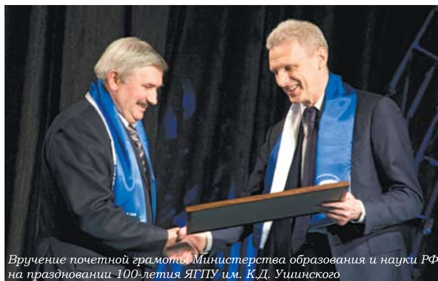
Вручение почетной грамоты Министерства образования и науки РФ на праздновании 100-летия ЯГПУ им. К.Д. Ушинского

вает рядовой учащийся из другого региона, который не обучался по сопряженным с университетом планам, и которому мы отказываем в приеме. Правда, у этой медали есть и обратная сторона: к нам в Ассоциацию вступили колледжи и училища из Бежецка, Калязина, Котласа, Сыктывкара и Великого Устюга.